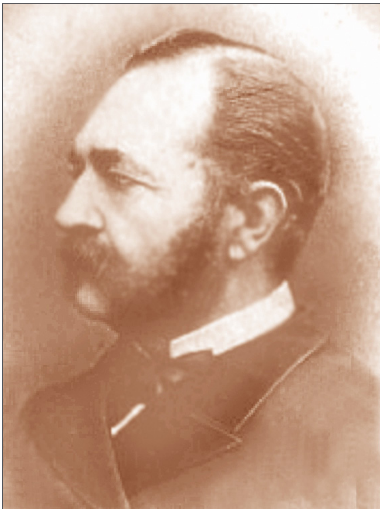
El "Presidente industrial" Aniceto Arce (1888 - 1892)