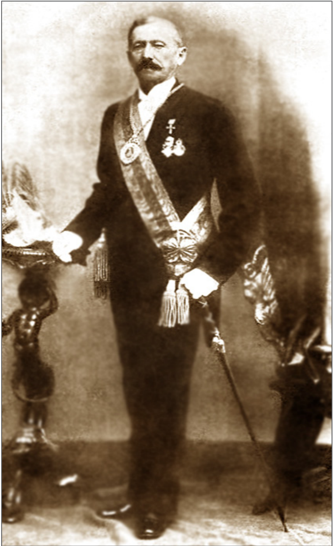
Gregorio Pacheco, el primer "minero" que llegó a la presidencia de Bolivia. Gobernó entre 1884 y 1888.