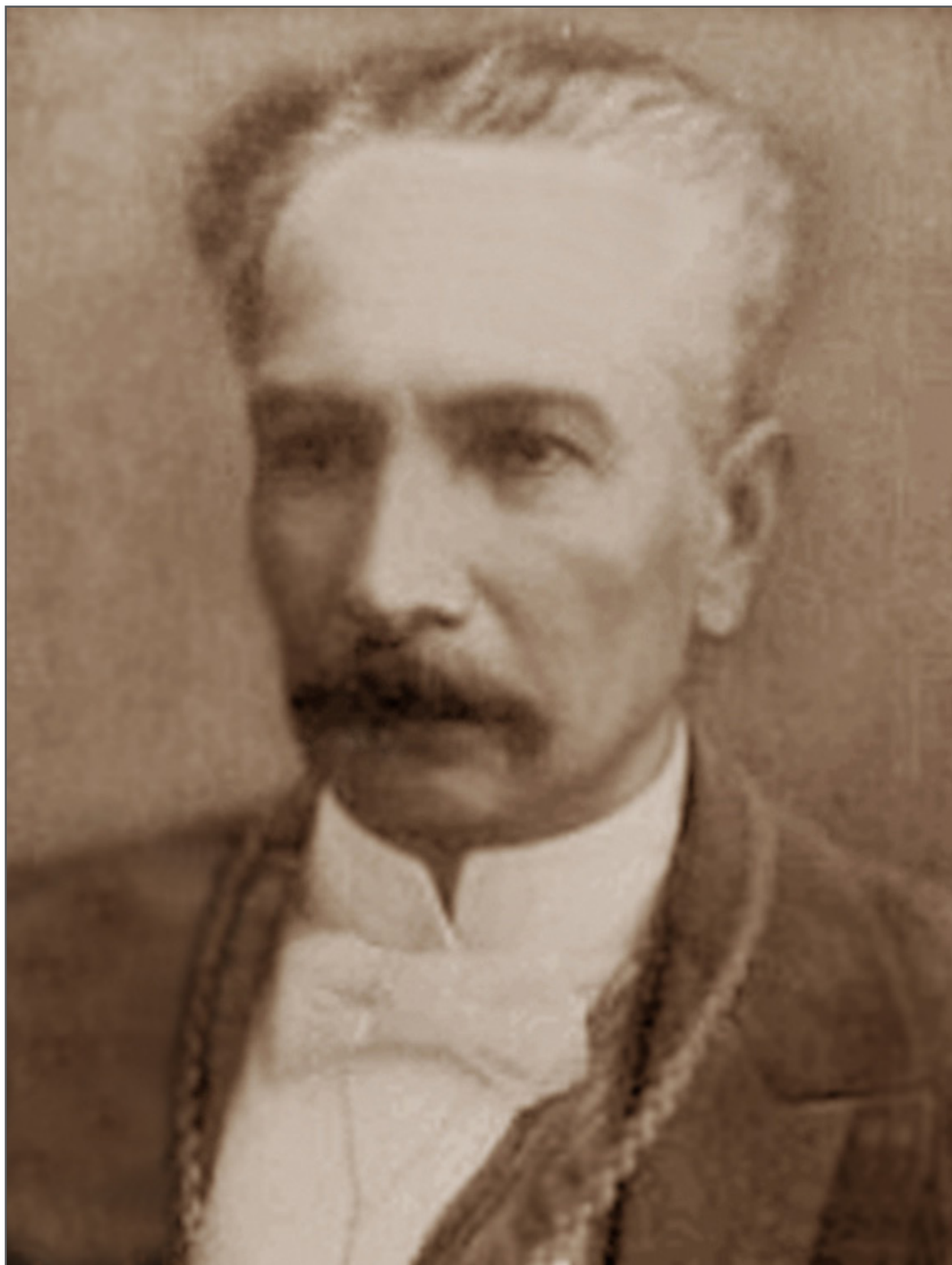
Mariano Baptista, Presidente de la República (1892 - 1896)