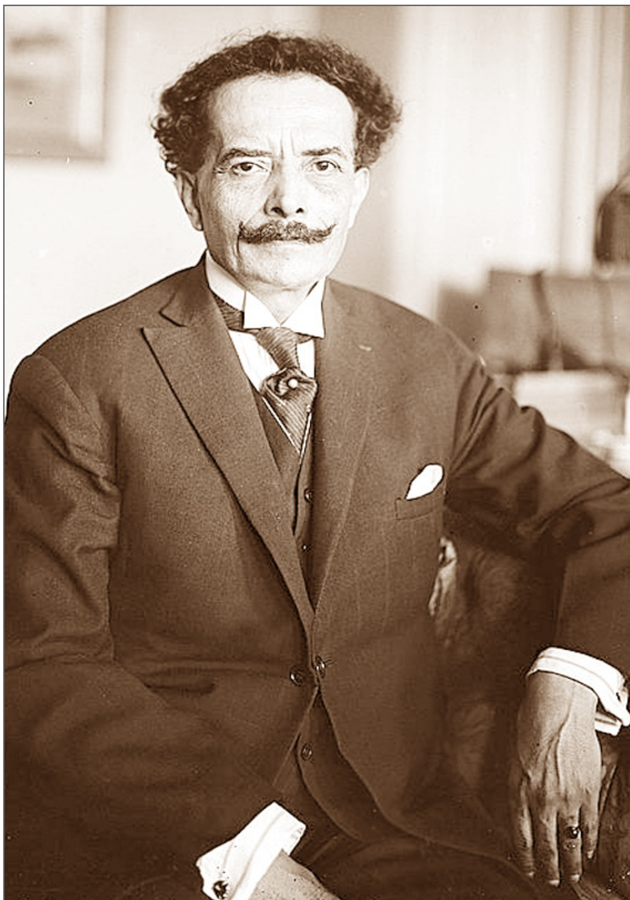
El poeta Ricardo Jaimes Freyre (1868 - 1933) militancia "socialista" en el Argentina